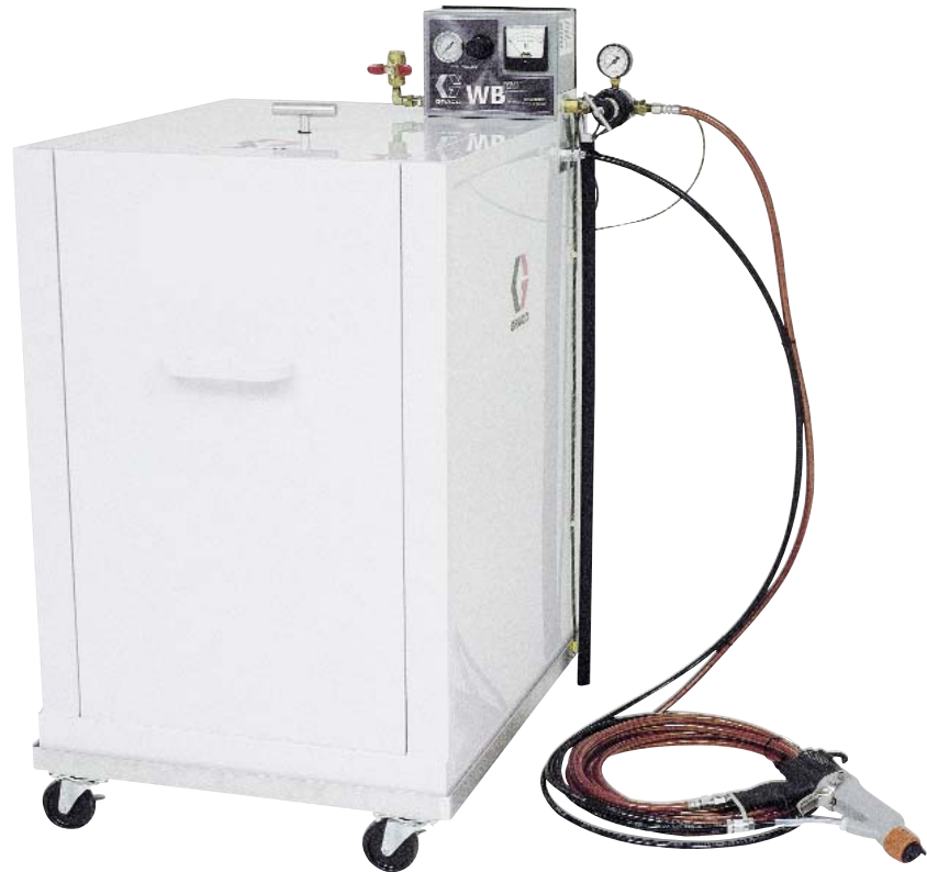
Abgebildetes Modell: 245897

Isoliersystem für Materialien auf Wasserbasis